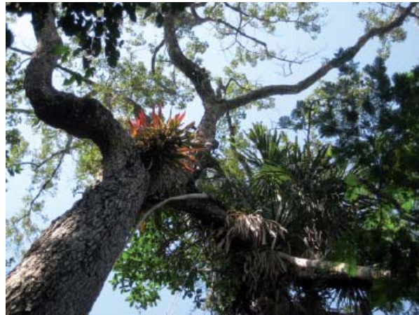
Selva Lacandona.

Mediante el desarrollo, una célula fecundada o un conjunto de células idénticas dan lugar a los complejos organismos del mundo vegetal y animal, y cuando estos procesos de desarrollo evolucionan se genera la gran diversidad de formas vivas que conocemos.