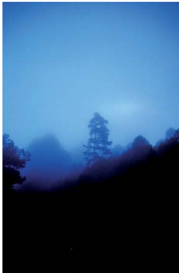
Sierra norte de Oaxaca.

Este tipo de información ha resultado ser muy importante para nuestro país ya que nos permite establecer estrategias de conservación de especies que son endémicas o se encuentran amenazadas, como es el caso de los abetos mexicanos. Por ejemplo, hemos estudiado poblaciones de estos árboles ubicadas a lo largo del eje volcánico transversal y se ha determinado que son genéticamente distintas entre sí, por lo tanto recomendamos conservar casi todas ellas con el fin de mantener la mayor cantidad de variación genética posible. Llevar a cabo sugerencias como ésta (basadas en estudios moleculares) se vuelve necesario hoy en día para conservar la enorme biodiversidad que tenemos en México.