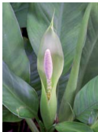
Dieffenbachia seguine.

Desde el punto de vista abiótico, la fragmentación puede cambiar las condiciones físicas del hábitat y con ello afectar la supervivencia de las especies. Desde el punto de vista biótico, la fragmentación puede alte-