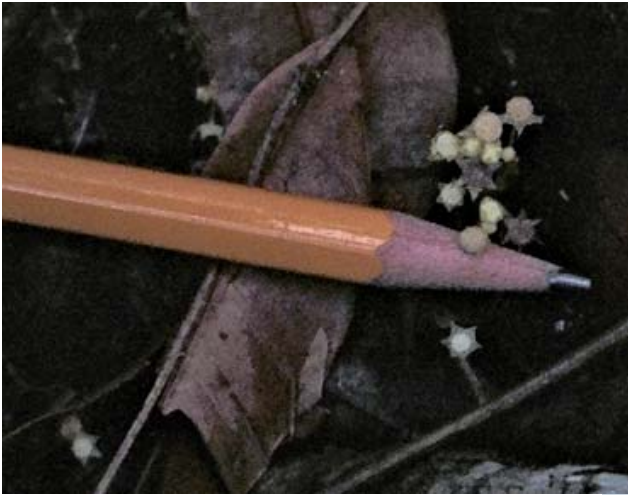
Lacandonia schismatica . Fotografía: Alma Piñeyro