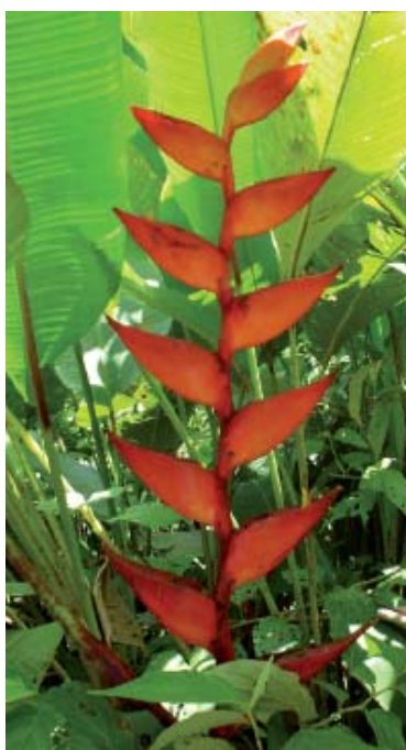
H. uxpanapensis.

En el laboratorio de Genética Ecológica y Evolución, nuestro grupo de investigación se ha dado a la tarea de estudiar los efectos de la fragmentación en la selva húmeda tropical de Los Tuxtlas, Veracruz, analizando un grupo de especies con diferentes historias de vida (hierbas, arbustos, y árboles). La motivación de este proyecto deriva de dos hechos: en primer lugar la selva de Los Tuxtlas constituye el límite norte en el continente americano de las selvas húmedas tropicales (que son el ecosistema