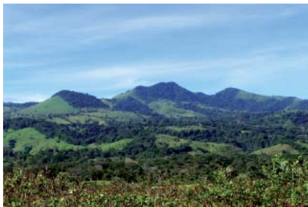
Selva de los Tuxtlas.

La fragmentación de los hábitats naturales es un proceso casi universal e irreversible, y la comprensión de sus efectos ecológicos y genéticos nos permitirá, en un futuro no tan lejano, diseñar estrategias de conservación de la biodiversidad a este nivel.