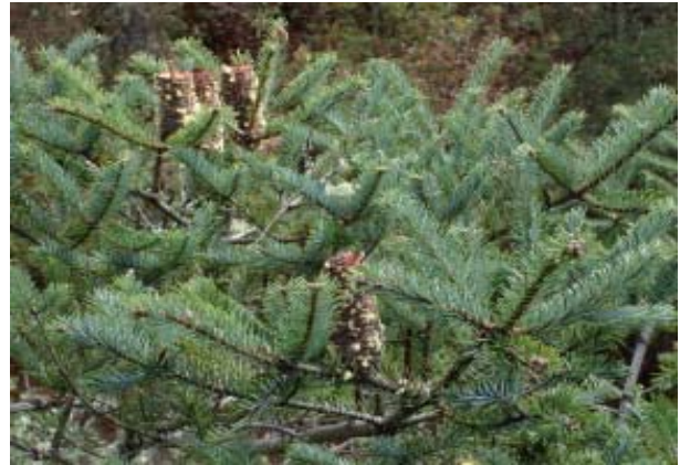
Abies religiosa .

Los abetos ( Abies Miller) por ejemplo, son taxa predominantemente boreales y de zonas templadas. En México podemos encontrar ocho especies de estos árboles ( Abies concolor , A. durangensis , A. durangensis