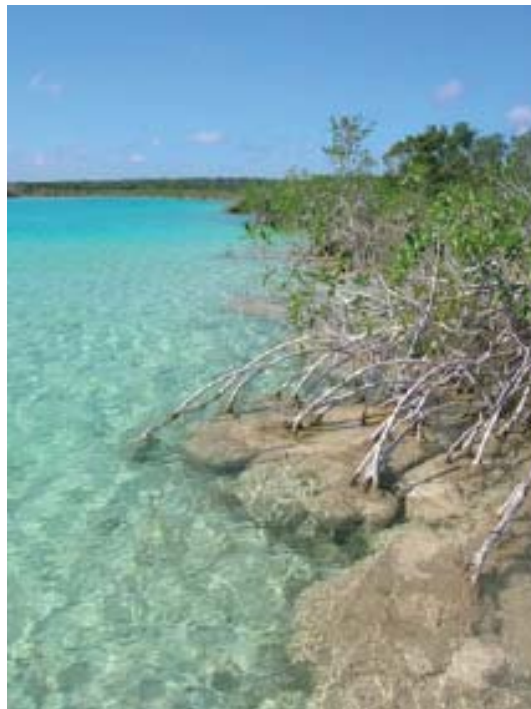
Bacalar, Quintana Roo.

La conservación de estas formaciones bacterianas equivale a exigir que se mantengan condiciones de salud ambiental que promuevan la existencia de una gran diversidad biológica.