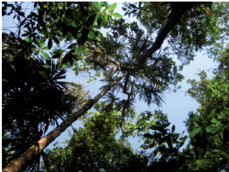
Selva Lacandona.