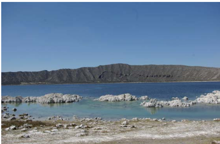
Alchichica, Puebla.

Los organismos autótrofos ( autos = propio; trophe = nutrición, alimento ) son aquellos que producen su propio alimento a partir de compuestos inorgánicos. Los organismos heterótrofos ( heteros = diferente, otro; trophe = nutrición, alimento ) no pueden formar su propio alimento y dependen de formas de carbono sintetizadas por organismos autótrofos.