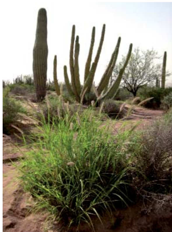
Vecino indeseable del desierto de Sonora, Cenchrus ciliaris (pasto buffel).

En orden decreciente estos son: el cambio en el uso del suelo, el cambio climático, el incremento en la deposición de nitrógeno, la presencia de especies invasoras (especies exóticas o no nativas cuya introducción causa, o es capaz de causar daños económicos, ambientales, o a la salud humana) y el incremento en bióxido de carbono en la atmósfera.