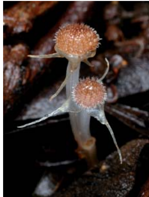
Triuris brevistylis .

En el caso de Lacandonia , los genes homeóticos de la flor funcionan de manera distinta al resto de las especies con flores. Dichos genes fueron caracterizados por primera vez en una especie modelo, Arabidopsis thaliana , y al estudiarlos en Lacandonia hemos descubierto que uno de ellos, llamado APETALA3 (cuya función está involucrada en la formación de estambres) se expresa en el centro de la flor desde las primeras