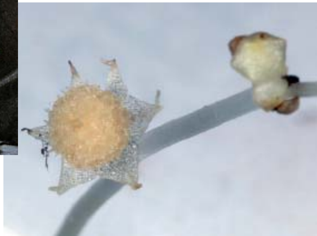
Detalle de Lacandonia schismatica .

Lacandonia schismatica es una pequeña planta hialina que crece entre la hojarasca de la selva. Es endémica de la selva Lacandona en Chiapas y su importancia radica en que, de las 250 mil plantas con flores conocidas en el mundo, esta es la única con una estructura invertida en sus órganos sexuales: tiene los órganos masculinos o estambres en el centro de la flor rodeados de los órganos femeninos o carpelos. Esta peculiaridad ameritó la creación de una nueva familia: Lacandoniaceae; aunque estudios recientes sugieren